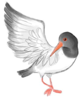
Minulla on ihanat kädet