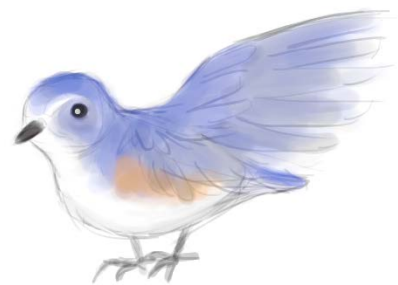
Koen itseni terveeksi