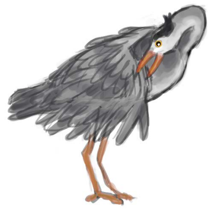
Pidän kehostani huolta