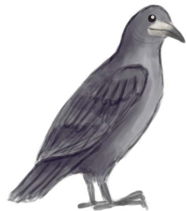
Olen ylpeä kehostani